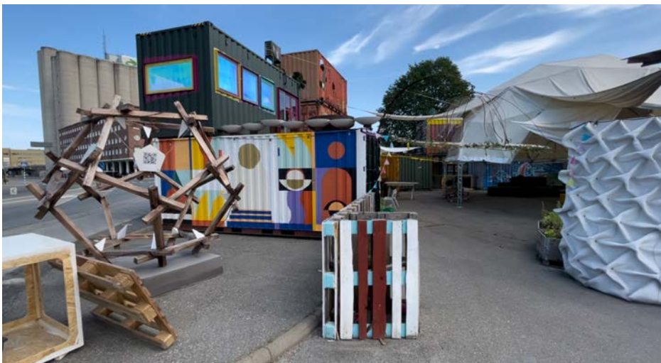
Frihamnstorget under uppbyggnad, sommaren 2021

Platsen där Blivande och Frihamnstorget finns kommer att exploateras sist i det stora stadsbyggnadsprojektet Norra Djurgårdsstaden, och vi förväntar oss att kunna verka på området under de kommande 10 åren. Detaljplanen för Frihamnen har ännu inte fastställts, vilket också skapar utrymme för att påverka områdets framtida karaktär. Att Stockholms stad stödjer initiativet är avgörande, vilket blev tydligt då projektet fick 200.000 kronor för en kulturscen på Frihamnstorget.