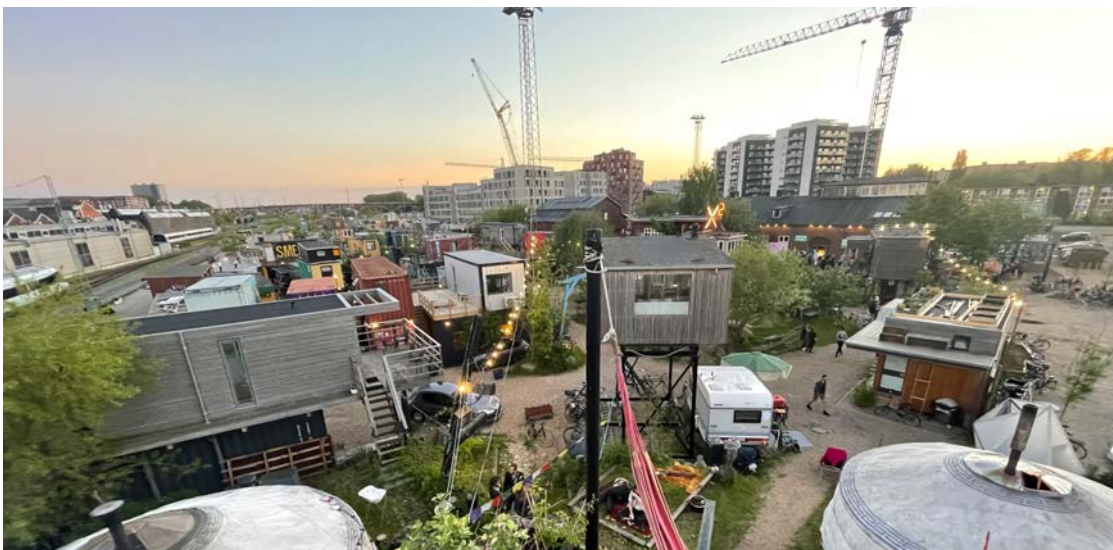
Institute for X i Aarhus, 2021. I bakgrunden syns nybyggda bostadshus.

uttryck. Även miljön runt omkring konstruktionerna är formbar och genom åren har användarna själva förvandlat vad som tidigare var en platt grusplan till en grön oas med snirklande stigar och små torg.