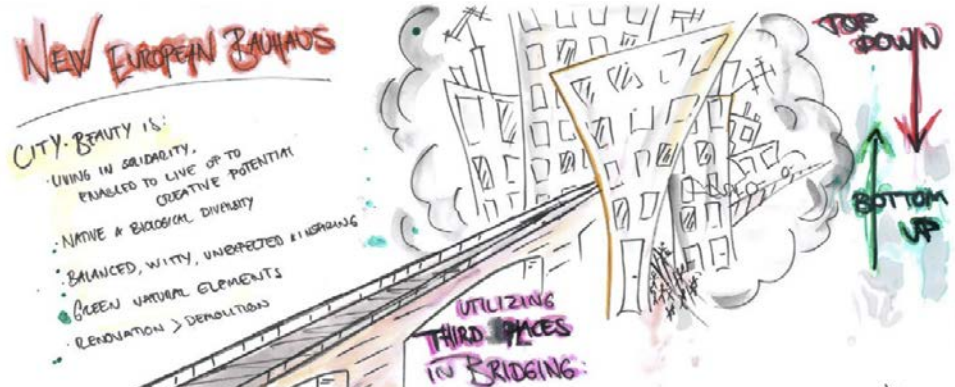
Illustration från officiell dokumentation av labb 11 från konferensen "Common Ground: Making the Renovation Wave a Cultural Project". Beskriver hur platser som Institute for X blir bryggor mellan gräsrotter och traditionell stadsplanering.

Pandemin och dess konsekvenser skapar dessutom nya förutsättningar. Ett ökat distansarbete skapar utrymme för människor att söka sig till platser där de trivs. Modulära och dynamiska miljöer som omformas efter behov ger oss förutsättningar att på ett iterativt sätt upptäcka hur vi kan leva och arbeta tillsammans i framtiden.